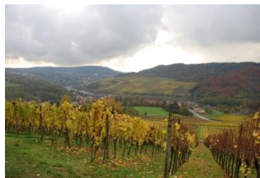
Blick von Perl nach Schengen

14,00 Uhr: Nachmittags tauchen wir beim Besuch der Villa Borg in Perl an der Mosel in die Zeit der Römer ein. Von einem tollen Aussichtspunkt können wir einen Blick nach Luxemburg auf das Städtchen Schengen werfen