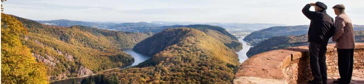
Saarschleife bei Mettlach

09.00 Uhr: Abfahrt vor dem Hotel Domicil Leidinger: