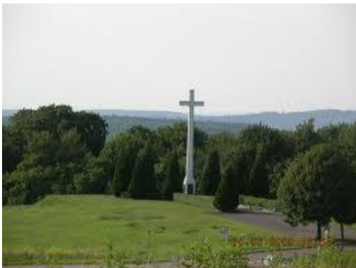
Ehrenmal in Spicheren 1870/1871

Zum Gedenken an die gefallenen französischen und deutschen Soldaten der Schlacht vom 6. August 1870 machen wir noch einen kurzen Halt am Ehrenmal in Spicheren.